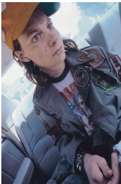
„Pilves“, 2002. Režissöör Jonas Åkerlund .

Filmiajalooliselt asetub „Pilves“ (või sisuliselt ehk isegi sobivamalt „Tsükliis“) ühte ritta Danny Boyle’i „ Trainspottingu “ (1996), Terry Gilliami „ Ratastel Las Vegasesse “ ( Fear and Loathing in Las Vegas , 1998) ja Darren Aronofsky „ Reekviemiga unistusele “ ( Requiem for a Dream , 2000), kui mainida hiljutisemaid teetähiseid narkofilmide põnevas reas. Kui nimetatud filmilugudel oli omamoodi arvestatav side reaalsusega, nagu me oleme harjunud nägema, siis Åkerlund püüab narkomaani maailma väljendada juba muudetud võtmes – pleekinud ja samas teravustatud värvigamma, hektiline montaaž, kiirete plaanimuutustega edasi antud juhuslikud detailid ning groteskini heroiseeritud narkosõltlased alates tarvitajatest kuni ainevalmistaja endani. Peategelase lugu