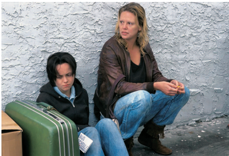
„Koletis“, 2003. Režissöör Patty Jenkins. Christina Ricci (Selby) ja Charlize Theron (Aileen).

kuid visuaalkultuuri naudingulise aspekti uurivad juhivad tähelepanu sellele, et filmid, reklaamid, videod jt pildid mõjutavad ka meie alateadvust. Viimast arvesse võttes võiks väita, et ühe või teise seisukoha, tähenduse, teema jne professionaalselt kõrgetasemeline visualiseerimine omab varem või hiljem mingeid tagajärgi üldise mentaliteedi mõjutajana.