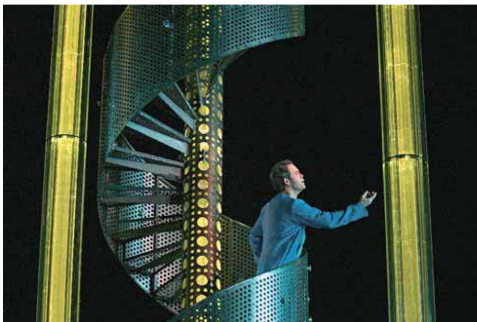
Trubaduur Jaufré Rudel (Gerald Finley) laulab kaugest armastatust.

non) krahvinna Clémence (lapsena võõrale maale mehele pandud provanslanna) ning et Jaufré sõitis orienti tema pärast, haigestus laeval ja, vaevalt randa jõudnud, suri armastatu käte vahel.