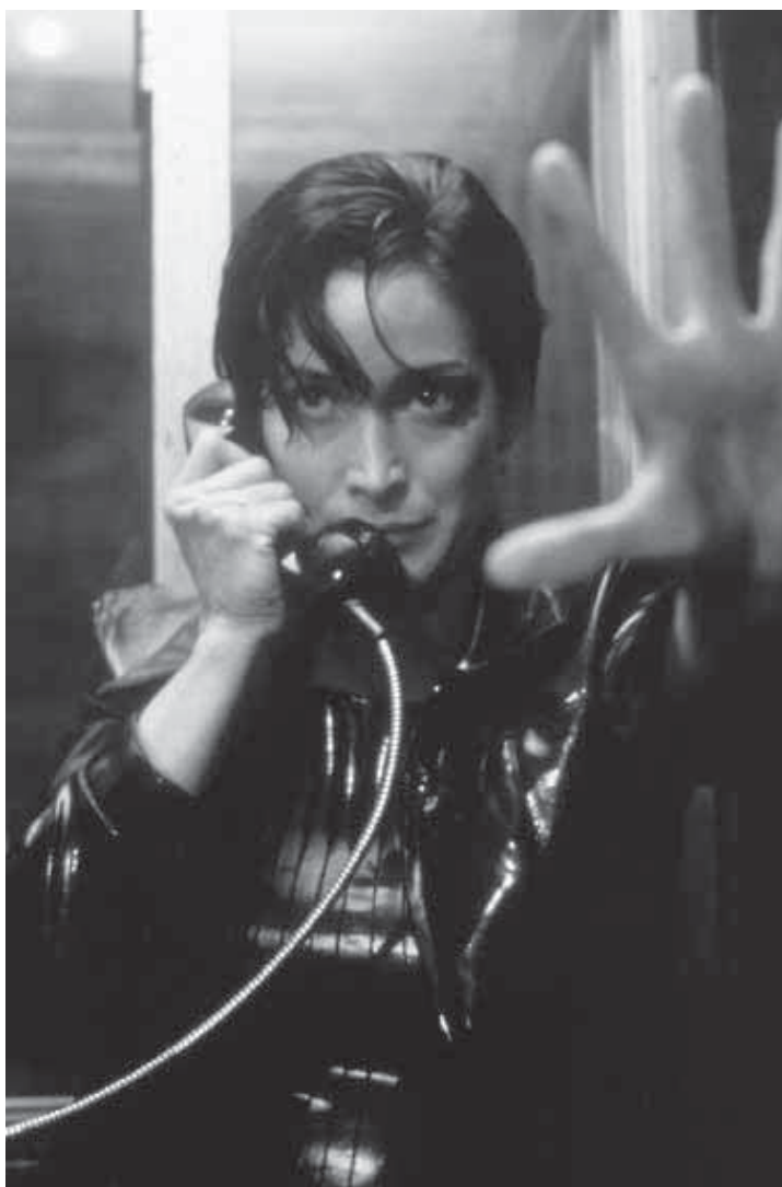
„Matrix“. Carrie-Anne Moss (Trinity).

näidata, mismoodi „ükskõik mis“ ennast kehtestab. Kui juba suurim ja traagilisem ettemääratus (teadvusetud, voolikute abil kontrollitavad kehad vannides) võib tuua suurima vabaduse ja õnne (puhkus „Vahitorni“ kaanelt tuntud paradisis), siis on ju selge, et sedasama võiks teha ükskõik mis.