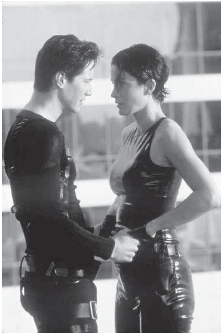
„Matrix“. Keanu Reeves (Neo) ja Carrie-Anne Moss (Trinity).

võib kohata selle skeemi mikromudel- dusi. Mitmed tegelased, näiteks Arhi- tekt ja Oraakel 4 , kellelt peategelane saab oma eesmärgi täitmisel väiksemaid teadmisi, teatavad, et nad on peatege- last/vaatajat oodanud ning et see koh- tumine „pidigi aset leidma“.) Sellise pa- hupidipööratusega, „tagasi tulevikku pöördumisega“ tagatakse narratiivi enes- sessesuubumine ja seesmine suletus; „Matrixi“ filmiseeria puhul pole enam tegu mitte niivõrd mingi narratoloogi- lise mudeli läbimängimisega (ehkki se-