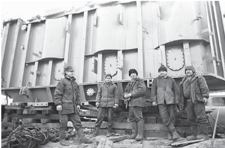
„Transformaator“, Venemaa – Šveits, 2004.