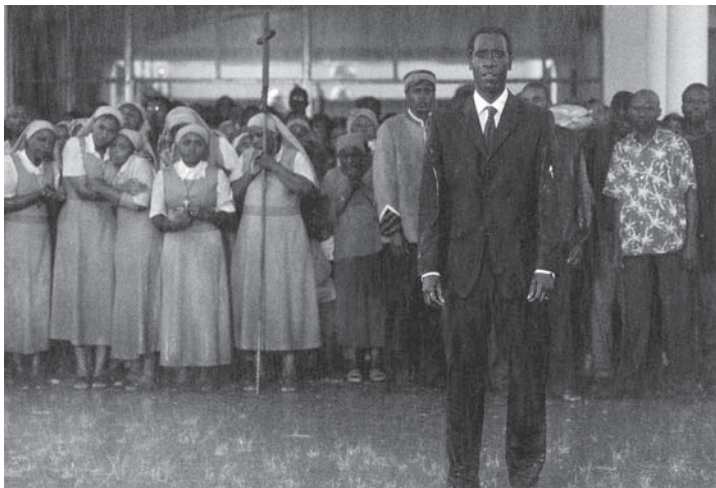
„Hotell Rwanda“, Lõuna-Aafrika, 2004. Režissöör Terry George. Don Cheadle (Paul Rusesabagina).

Näiteks „Schindleri nimekiri“ ja „Pianist“ on tublisti kasumit toonud ja teisedki on end tasa teeninud. Nii et poliitilise sisuga filme ei tasu siiski karta, ajuvaba meelelahutust toodetakse niigi hulgi.