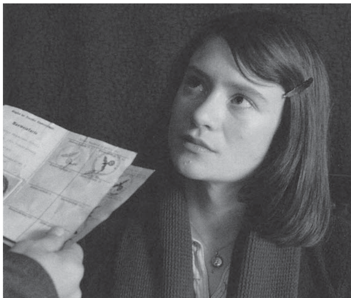
„Sophie Scholli viimased päevad“, Saksamaa, 2004. Režissöör Marc Rothemund. Julia Jentsch (Sophie Scholl).

tivaliga seonduvat edastas „Berlinalel“ operatiivselt „Raadio 1“ ( Radio Eins ), mille buss asus kõik need päevad Potsdamer Platzil.