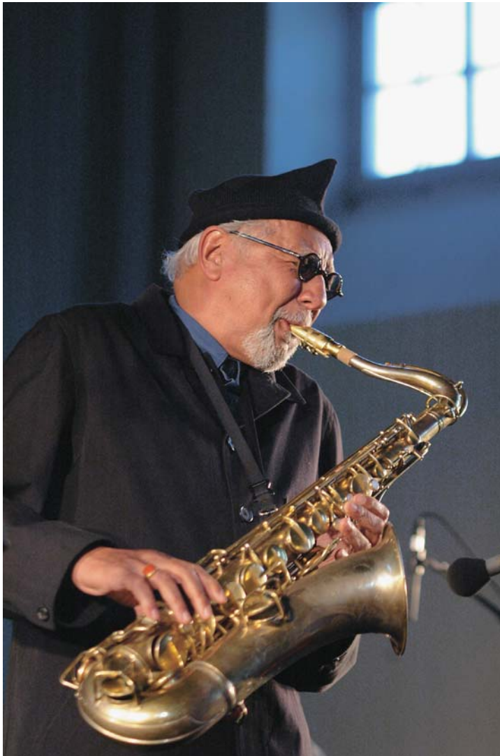
Charles Lloyd oli ilmselt kõige põnevam kuulata neil, kes juhtusid olema ka tema legendaarseks saanud kontserdil Tallinnas kolmkümmend aastat tagasi.

ni välja, ja mängis ka minitrompetit (?). Aga oma esinemise lõpu eel demonstreeris ta ürgset kõrilaulu koos vilepillimänguga, mis oli kontserdi üks ereda- maid kõlaleide.