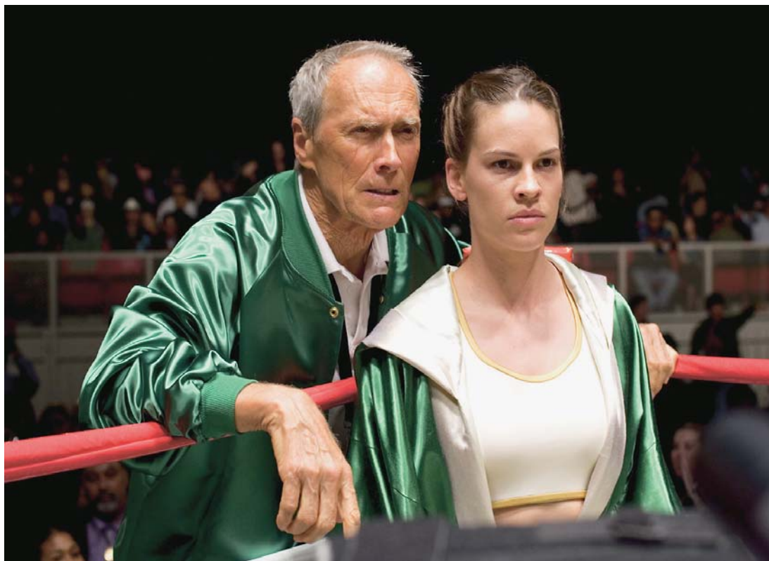
„Miljoni dollari tüdruk“. Clint Eastwood (Frankie Dunn) ja Hilary Swank (Maggie Fitzgerald).

mal. Ka tagasivaade, nagu filmi lõpuks selgub, on aktiivne. Tagasivaade on kiri, mida saali hooldaja kirjutab Frankie tütrele.