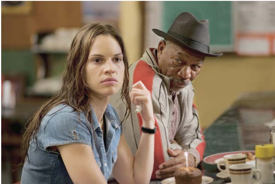
„Miljoni dollari tüdruk“. Hilary Swank (Maggie Fitzgerald) ja Morgan Freeman (Eddie Scrap-Iron Dupris).