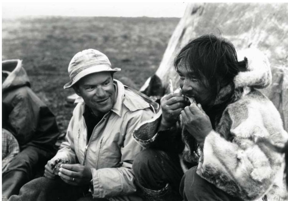
Asen Balikci 1963. aastal netsilik eskimote juures.

„tõelist“ olukorda. Samuti ei sisalda film hala hantide halva olukorra teemal (mis on iseenesest muidugi niikuinii olemas, ainult et filmist väljaspool). Tegu on jõuka perega, kus isa töötab naftatööstuses ning allakäiku pole kuskil näha. Seega edukas kohanemine oludega ning kultuuri tuumalge – perekonna – kooskõlaline toimimine. Näeme õnnelikku väikemaailma metsa keskel.