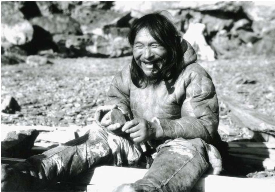
„Talvises merejäälaagris“, 1963. Režissöör Asen Balikci.

„ Kuu Ephtim D. elust “ ( A Month in the Life of Ephtim D , 1999) ning „ Tingvong “ (2005). Peale selle oli Charles Lairdi film „ Läbi nende silmade “ ( Through These Eyes , 2003), mis oli samuti seotud Balicki pärandiga. Selgi juhul keskenduksin vaid ühele filmile, sest sellega seostus teatud mõttes muudki festivalil näidatud.