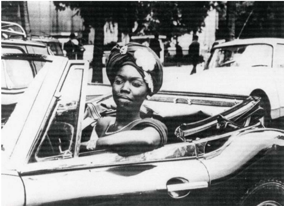
„Jaaguar“, 1967. Režissöör Jean Rouch.

lisaks üks Rouchi elutööd käsitlev teos. Kõigest kirjutada pole ehk vajadust, piisab näiteks „Jaaguaristki“. See film on tõelistest Nigeeria meestest, nende rändamisest mööda maad Kullarannikule, mis on üks suur laot, kus töötatakse, ostetakse uusi valgeid särke ja muud tráni. Kogu aeg naerdakse, kogu aeg räägitakse. Filmitavad on ühtlasi ka filmi tegijad. Mehed ise seletavad, mis nad teevad, ja ega millestki muidu polekski võimalik tuhkagi aru saada. Nad ei võta justkui midagi liiga südamesse. Täpselt nagu me kujutamegi ette tõelist aafriklast. Kuid elu tavaline olemus on siin siiski kuskil peidus, kogu selles väljamõeldiste virvarris.