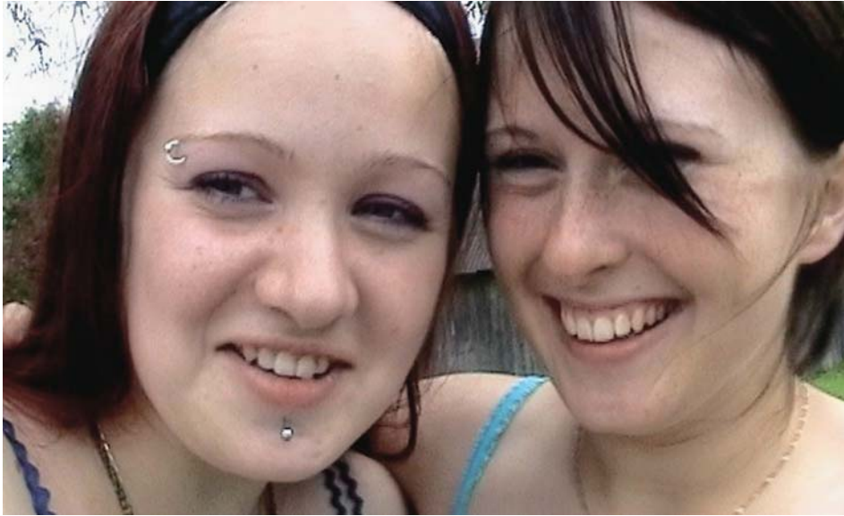
„Elluastujad“, 2004. Režissöör Liina Triškina.

sitluse ning analüüsi kaudu või inimestel vabalt lobiseda lastes või neid vaikivatenäidates viivad meid sarnaste või erinevate tulemusteni.