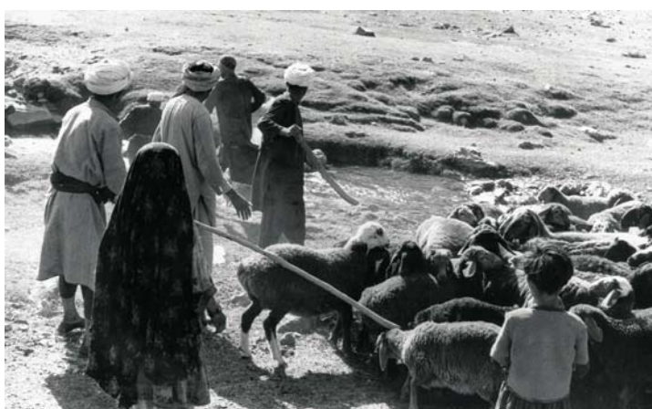
„Haji Omari pojad“, 1978. Režissöör Assen Balikci.

on ekspressiivsed aafriklased, ühes seletavad teadlased ja teises lihtsalt (eba)tavalised tüübid, ühes on valdav äng ning teises helgus, on mõlemad filmid