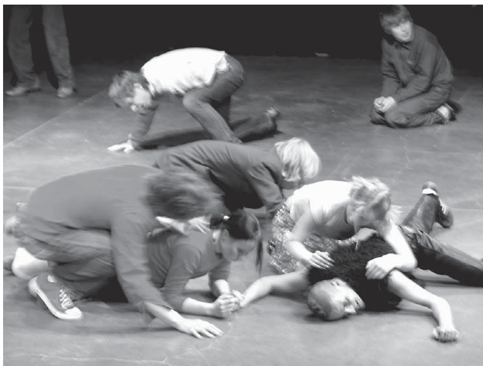
„There is no more Firmament“ Tartu Sadamateatris.

majutasin ühe öö oma kitsas korteris selle läbiviijaid. Workshop oli väga kummaline protsess. Eeskätt pean silmas seda Meierholdi biomehaanika keelduva liikumise omandamist, kus enne liikuma hakkamist meel ja keha kõhklevad hetke. Algul n-ö kõhklen, kas minna üle piiri, ja siis ikkagi lähen. Samas on ettevaatus tarvilik, et mitte ennast etenduse käigus füüsiliselt vigastada. Esimestel päevadel ei saanud ma tegelikult üldse aru, mida me teeme, lihtsalt oli põnev. Midagi hakkas koitma siis, kui maha istusime ja tükist rääkisime. Pärast vestlust tegime harjutust, kus seisime rivis ja pidime üle võtma üksteise liigutusi ja häälightsusi, neid võimalikult täpselt järele tehes. Esialgu oli raske etenduse teksti harjutusega kokku viia.