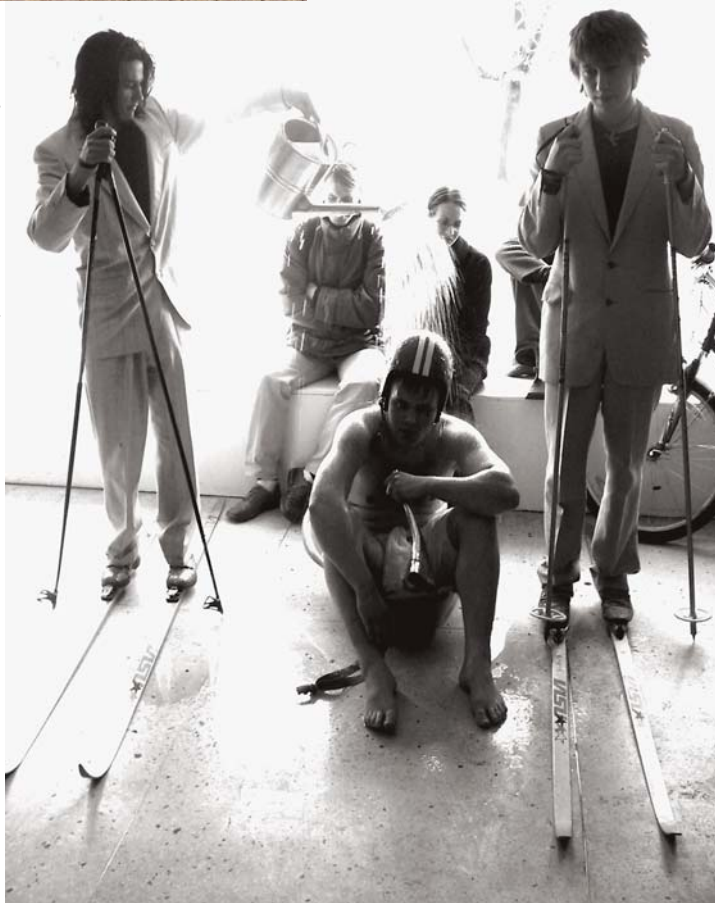
All: Rühmituse „Fašist Lendas Üle“ performance „Daamid ja härrad, lavale astuvad kangelased!“ Tallinna Kunstihoones 2. V 2005.