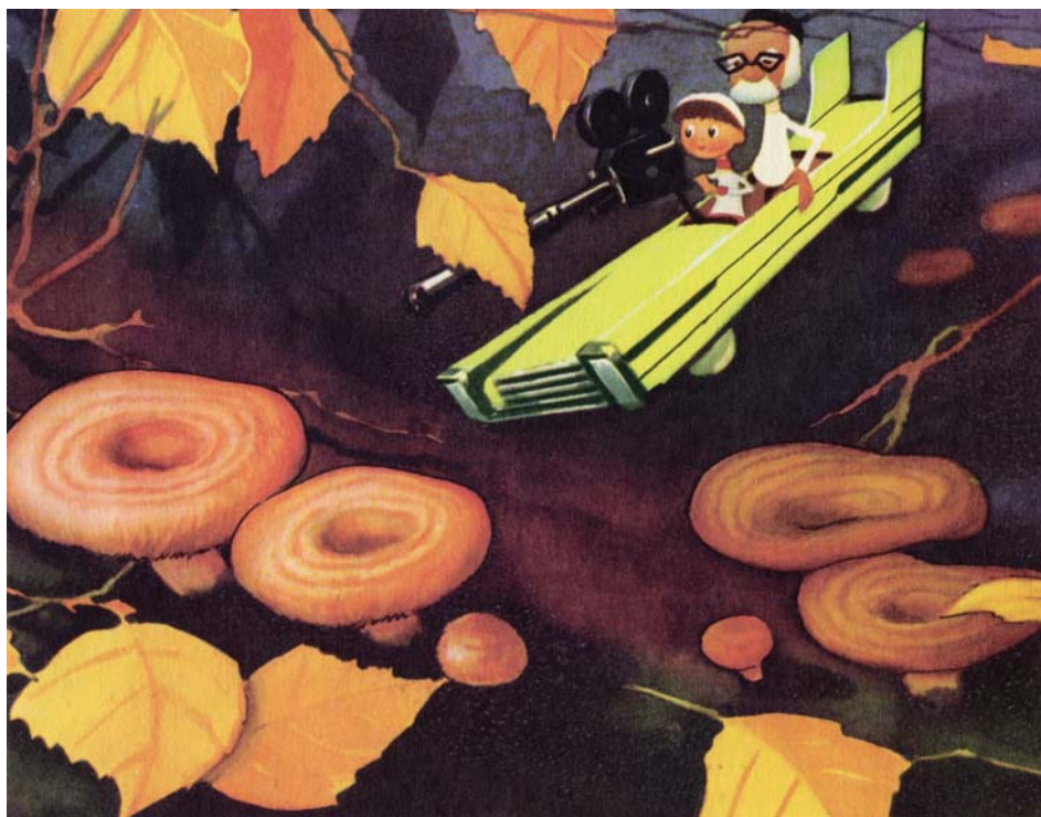
„Operaator Kõps seeneriigis”, 1964.

omast ning iseloomulikku oli,” ütleb Pars.