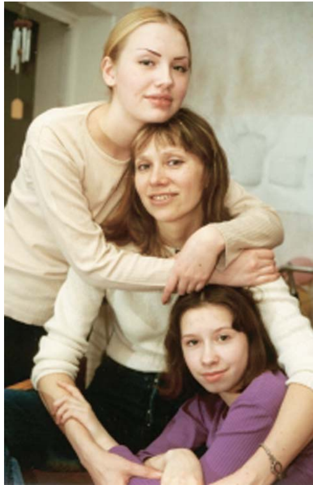
„Marina Kuvaitseva ja üksildased naised“, 2004. Režissöör Arvo Iho.

„ Sensatsiooniline Tartu kevadbänd “ (rež Madli Lääne , „Allfilm“). Uuesti tekkis analüüsi korraldajatel küsimus, et mida on selle filmiga õieti öelda tahetud. Režissööri sõnul on tegemist looga „noortest inimestest, kes on pisut teistmoodi kui tavalised eesti noored“. Jälle pälvis kiidusõnu filmi algus, kuid