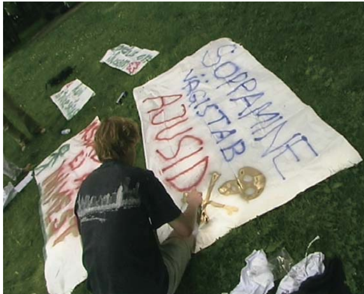
„Sensatsiooniline Tartu kevadbänd“, 2004. Režissöör Madli Lääne.