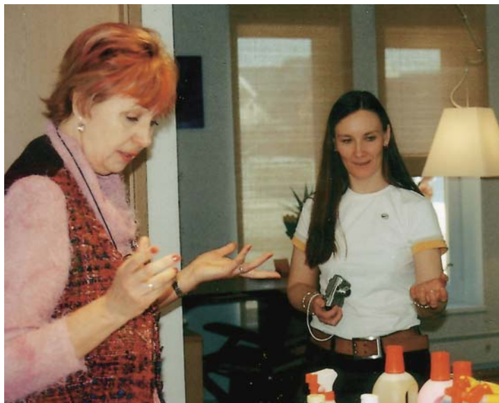
„Osta elevant ära“, 2004. Režissöör Õnne Luha.

analoogidele kolmapäeva õhtu ning pärast telelinastust pandi kõik filmid DVD-le ja müüki raamatupoodidesse.