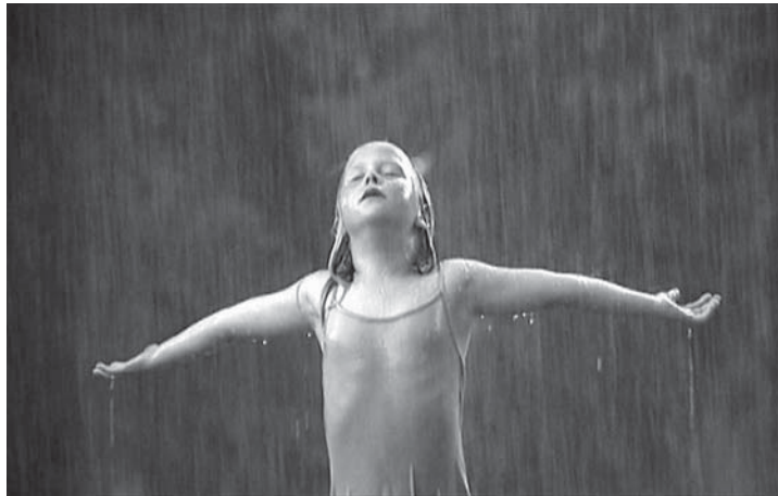
„Suvepilved“. Rootsi, 2004. Režissöör Axel Danielson.

õnneks ka krutskid ja veidrused ning jooksev lugu, millest lihtsurelik teatava pingutusega aru peaks saama.