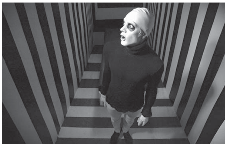
„Ninanokkija Apelsin“. Eesti, 2005. Režissöör Birgit Demidova.

ise). Just „Ground Zero“ sõelus terad sõkaldest ning sestpeale on mitmed filmistuudiod hakanud tudengite lühifilmide produtseerimises aktiivsemalt kaasa lööma.