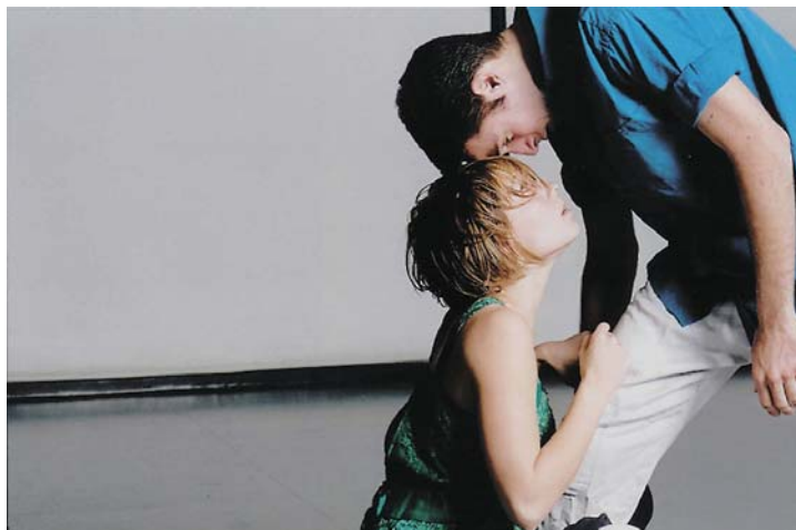
Noa Dar Dance Groupi „The Sweetest Embrace“.

Eelnevat silmas pidades oli näha, et ka „Augusti tantsufestivali“ publiku ootused olid erinevad: kes oli tulnud tantsu vaatama, kes aga nüüdisaegset video- või helikunsti nautima. Saalid olid täis ning mõne etenduse puhul lausa pungil. Märkamata ei jäänud ka osa publiku kohkunud ilmed, kui tantsija end ühel hetkel porgandpaljaks võttis ja segamatult edasi toimetas. Ikka juhtub. Kogenenumad vaatajad suhtusid asjasse muigega, sest eks ole juba näh-