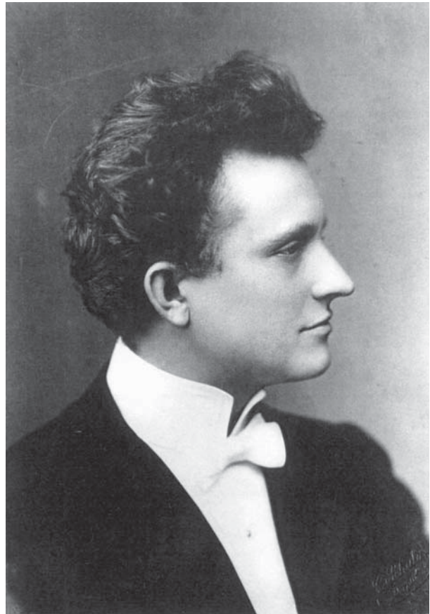
Rudolf Tobias 1905. aastal.

Jäid järele vaid Rudolf Tobias ja Mart Saar, kes olid võimelised meie muusi-