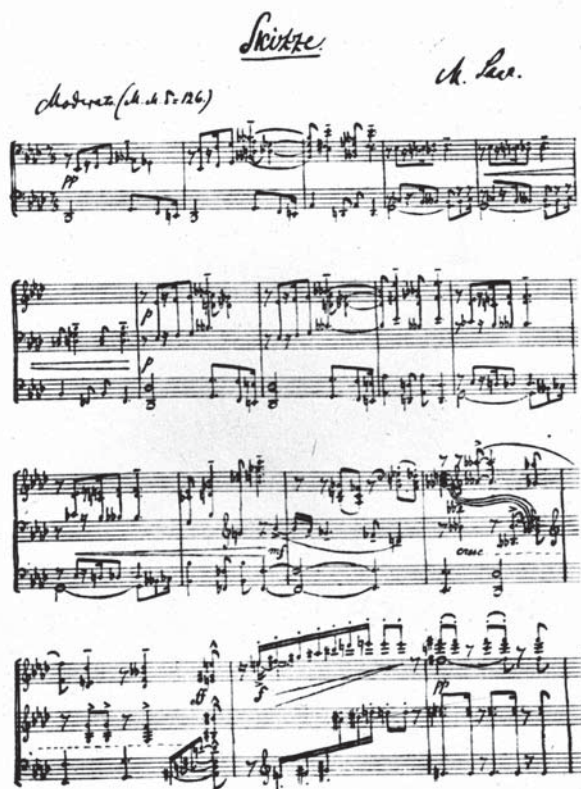
Mart Saar. Klaveripala „Skizze”. Autograaf.

Samal ajal köitis Saart Euroopa tolle aja moodne muusika. Debussy, Reger, Skrjabin, neist on ta korduvalt rääkinud oma mälestuskildudes. Nii kõikuski helilooja neil aastail mitmete vastandlike mõjusfääride vahel, kaldudes kord ühe, kord teise meeliseeskuju poole. Igatahes olid tema ettevõtmised nii ühel kui teisel pool äärmiselt julged. Tema klaveripala „Skizze“ (1910) paistab silma oma dissonantsikuhjatustega, polütonaalsuse piirjooni puudutava harmooniaga; soololaulus „Must lind“ tajume ekspressiivseid ülipingeid, hirmukomplekse. Ajal, mil eesti muusikas seisis veel aukohal asjaarmastaja Karl August Hermann kolmeduuriline koorilaul, olid sellised nähted muidugi ennekuulmatult äärmuslikud. Asjatult ei nimetatud heliloojat pilkavalt dissonantsijäägriks