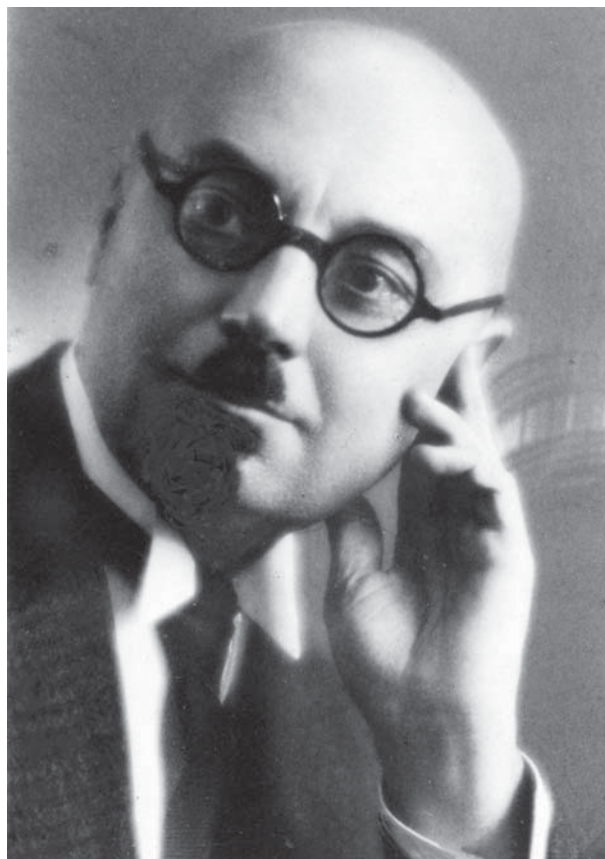
Mart Saar 1932. aastal.

Kahekümnenda sajandi algusaas- taid võiks nimetada teiseks ärkamis- ajaks Eesti kultuurilis-poliitilises elus. Eesti kodanlus oli võrreldes esimese ärkamisajaga XIX sajandi seitsme- kümnendail-kaheksakümnendail aas- tail märgatavalt tugevnenud. Jõudsalt oli arenenud tööstus, eriti metalli-, masi-