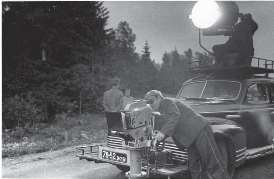
Telefilmi „Võlg“ võtetel 1966. aastal.