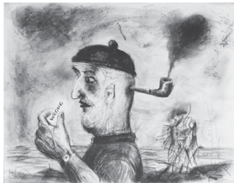
Priit Pärna graafika.