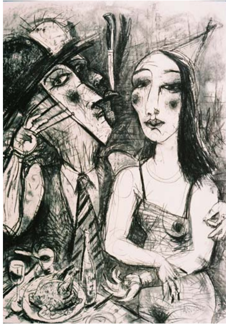
Priit Pärna graafika.