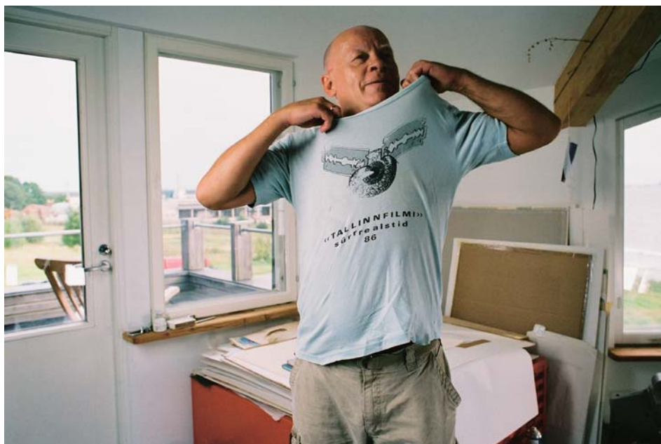
Priit Pärn Tallinnfilmi legendaarseid sürrealiste meenutamas.

ne, elegantselt hullumeelne visuaalne huumor, joonisfilmiliku sõnakunstiga mütopoetiseerimine ja uttu metafraseerimine.