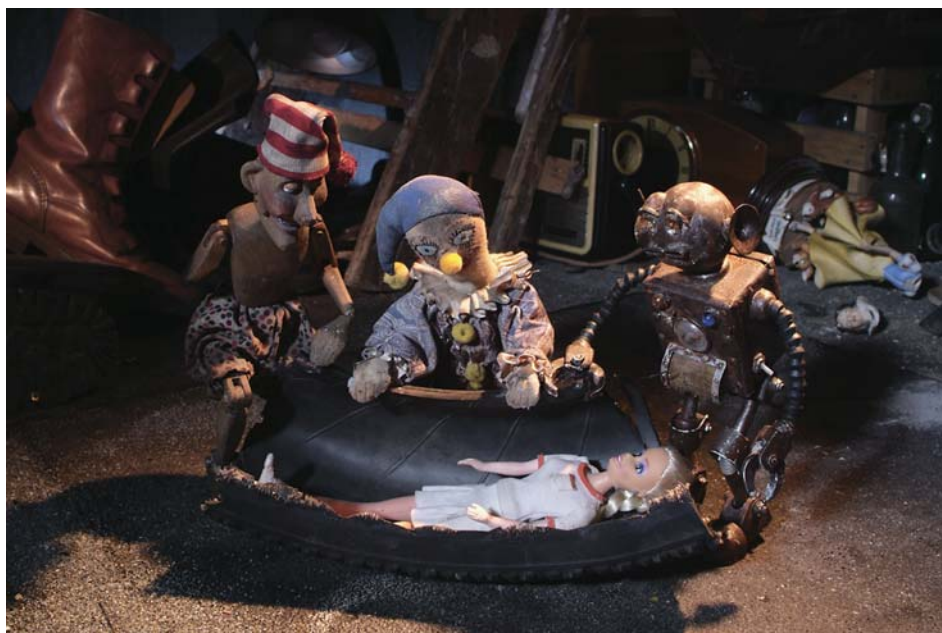
„Barbarid“, 2003. Režissöör Hardi Volmer.

oleks. Aga see on ju kõigile teada, kuidas nende asjadega praegu lood on. Et seda välja tuua ja sellisest asjast filmi teha, on üsna mõttetu käik.