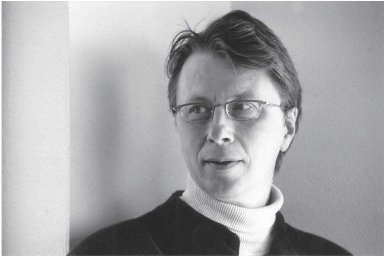
Helilooja Georg Friedrich Haas.

Mozarti surma-aastapäeva eelõhtul, 4. detsembril 2005 tuli Salzburgi Mozarteumis Salzburgi Bachi koori ja Mozarteumi orkestri esituses Ivor Boltoni dirigeerimisel esiettekandele Georg Friedrich Haasi „Sieben Klangräume zu den unvollendeten Fragmenten des Requiems KV 626 von W. A. Mozart“ koorile ja orkestrile („Seitse kõlaruumi Mozarti Reekviemi lõpetamata fragmentidele“). Üks hinnatumaid tänapäeva austria heliloojaid Georg Friedrich Haas ei asunud Mozarti Reekviemi autentsetele fragmentidele tänapäevast kontrapunkti kirjutama sugugi mitte isiklikust jul tumusest. Idee kommenteerida Reekviemi fragmente tänapäeva helikeeles