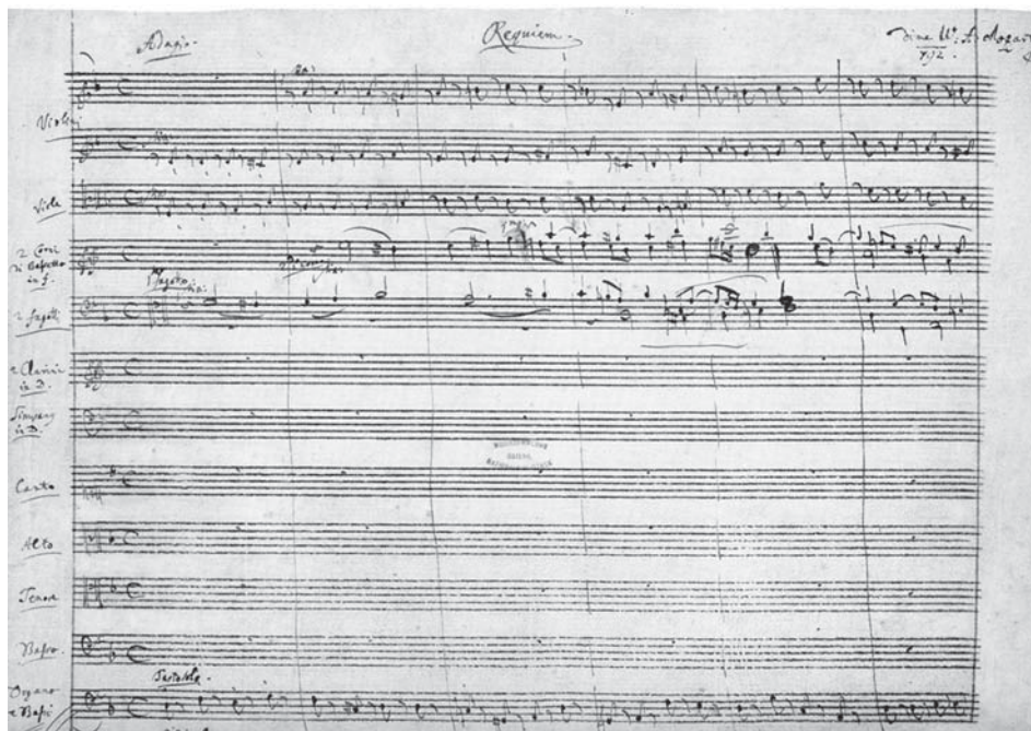
W. A. Mozart. Reekviem. Introitus . Fragment autograafist. Viini Rahvusraamatukogu.