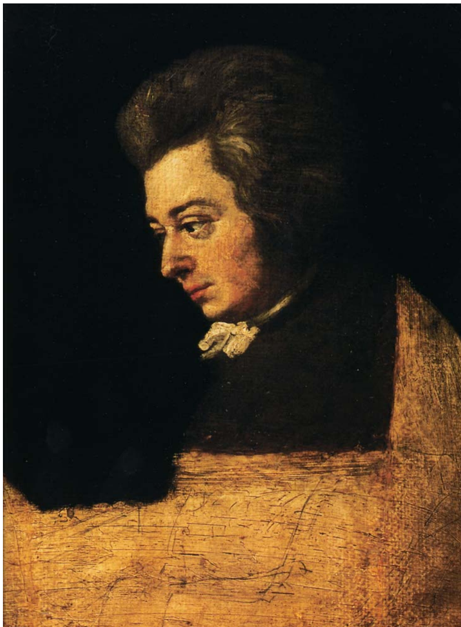
Joseph Lange. Mozart klaveri taga. Lõpetamata portree, 1789. Õli. Mozart Museum, Salzburg.