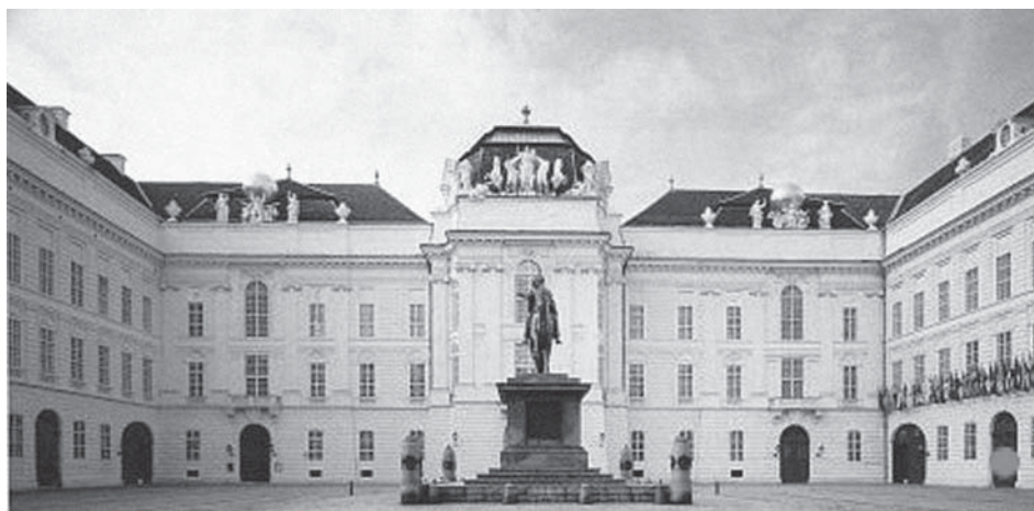
Viini kuulus kontserdipaik – Redoutensaal.

kusjuures kaastegevad olid tuntud Viini muusikud Antonio Salieri (1750–1825), Johann Nepomuk Hummel (1778–1837), Giacomo Meyerbeer (1791–1864) jt. 32