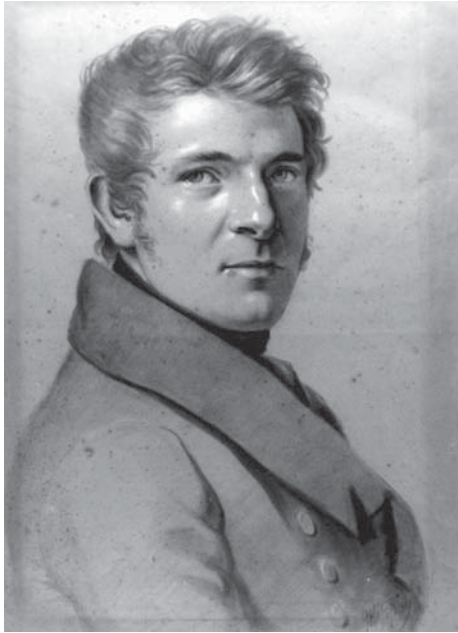
Gustav Adolf Hippus. Autoportree. 1820. aastad. Kriit. Kumu Kunstimuuseum.

ilme on osaliselt tingitud maski võtmisega seotud protseduuri ebaseadlikkusest. 25