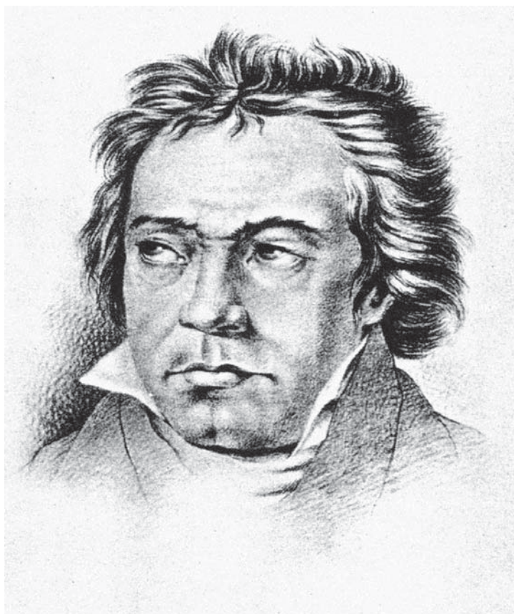
Gustav Adolf Hippus. Ludwig van Beethoveni portree. U.1814. Pliiats. Beethoven-Haus, Bonn.

SONI valduses. Portree on tehtud pliiatsijoonisena paberilehele suuruses 50 x 40 cm. Hiljem on see kleebitud kartongile. Moskva, 30. juuni 1927. Boris P. Jurgenson. 5 Joonistus on helilooja välimust tabav, selles puudub Hippuse hilisemale loomingle omane natsaareenlik idealiseerimine. Stiililt sarnaneb Beethoveni portreega Hippuse signeeritud autoportree 1820. aastate algusest (kriidijoonistus, EKM G 2258). Samuti võib leida analoogiaid litograafiate sarjast „Kaasaegsed” (näiteks „Ivan Krõlovi portree”, 1822). Inglise- ja saksakeelses kirjanduses on Hippuse loodud Beethoveni portreest korduvalt juttu, samuti on seda kasutatud illustratsioonina helilooja elu ja loomingu puudutavates raamatutes. 6 See on pälvinud erinevaid hinnanguid, ent keegi uurija-