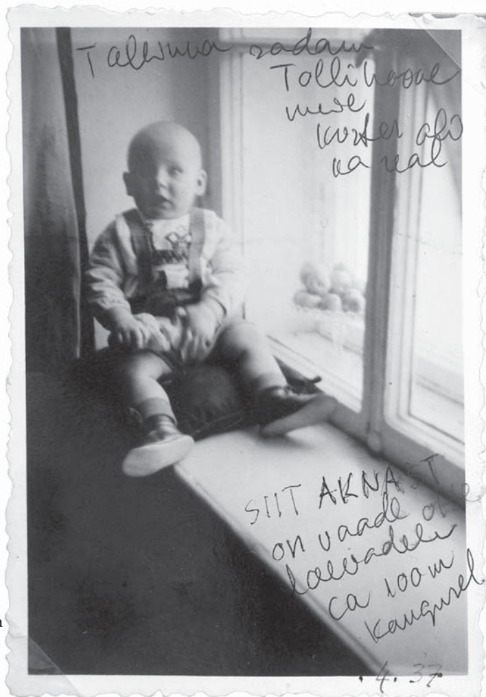
Avo ühe aastasena Tallinna sadama tollihoone kodus.