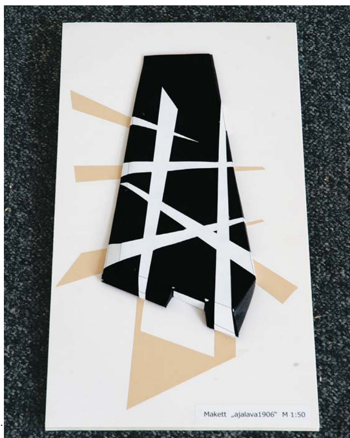
Rene Sauemägi, „Ajalava 1906“. Äramärgitud töö.

Tegelikult on parim kaasaegne skulpturaalne mõtlemine ise kaugenenud