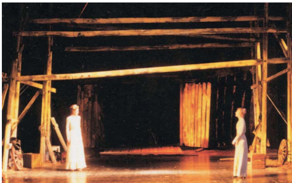
Eesti Draamateatri arhiivifoto