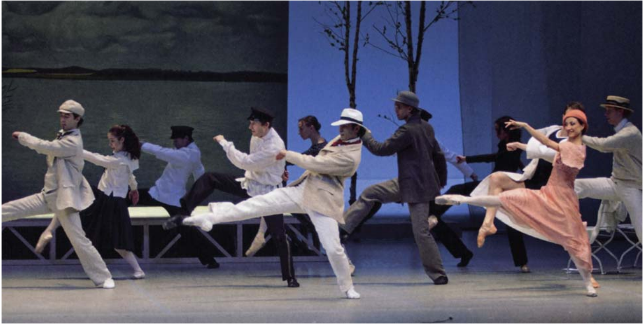
Stseen Neumeieri balleti „Kajakas” lavastusest Soome Rahvusoperis, 2006.

Selline polüfooniline stseen (nagu ooperiansambel, kus igal lauljal on oma partii ja oma muusikaline ning sõnaline tekst) teeb võimalikuks erinevate tunde- hoovuste üheaegse näitamise ilma segadust tekitamata – kujul, mis draamas oleks tunduvalt keerulisem. Kuid kehad (ja hääled) võimaldavad lahti rullida inimese „sisemaastikke”. Üks selline „maastik” on teises vaatuses, kus pärast revüüstseeni toimub Niina ja Trigorini vahel terav kokkupõrge, mis kutsub naises esile hirmude ja muude murede tulva, mida Neumeier näitab musta rõivastatud noormeeste abil, kes naist väntsutavad. Stseeni lõpus jääb Niina muremõtteis istuma, ta keha on liikumatu ja longus; „saatemuusika” aga on ergas ja lõbus, justkui irvitades tema kannatuste üle. Naine võtab kätega oma õlgade ümbert kinni, nagu kaitstes end ümbritseva ja ka oma sisemaailma külmuse eest. Ta ahistus väljendub kere tasases õõtsumises, kuid lõpuks purskub