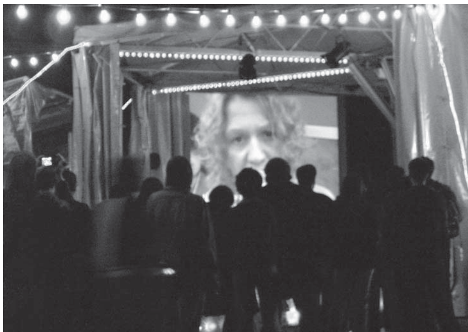
„Pablo Plusi supermarketis”. Vaataja põrkus selle ja mitme teisegi festivalilavastuse puhul küsimusega, miks valiti just selline tehniline lahendus, ilmselgelt igavam ja seega ka ärritavam kui traditsiooniline teater oma elava esinejaga.

luutselt ühist sotsiaalset mõõdet, nii et ainukese tõsiselt võetava võimalusena jääbki üle uurida oma kogemusvälja ning püüda seda siis mingil viisil abstraherida ja üldistada.