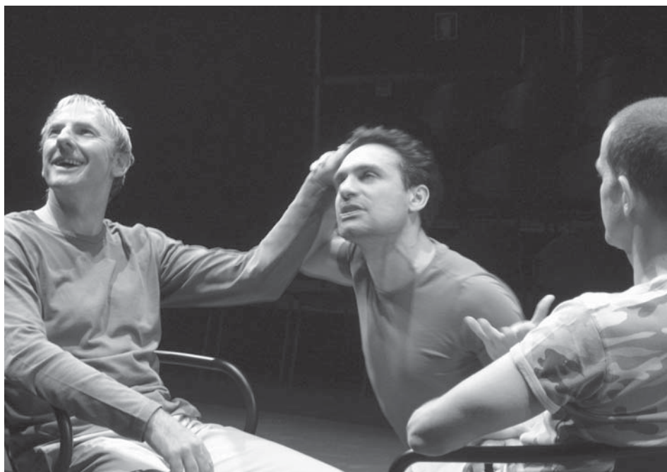
„Set Up“. Kuna tantsisid kolm meest, siis kordus ja võimendus väljatõugatuse, ülelõigse inimese teema, mida ei saa küll taandada ainult võrdlusele „nagu viies ratas vankri all“, kuid osaliselt ka seda.

säästlikkusest ja paljust muust, siis kes meist ei tunneks ennast patusena.