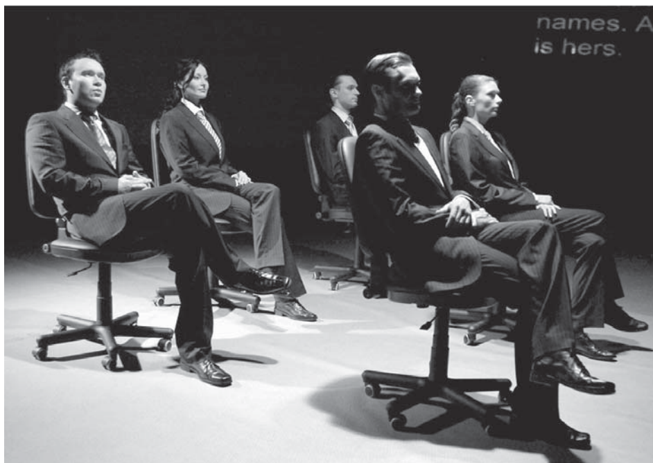
„Katsed tema elus“. Cezaris Groupi iseenesest hästi mängitud lavastus oli programmiliselt tekstikeskne ja visuaalselt absoluutselt minimalistlik, sest eeldatakse, et tõeline etendus sünnib nagunii vaataja peas.

segaseid tundeid ja mõtteid, kuid kunsti ülilm eesmärk ongi ju vaatajaid ühel või teisel viisil mõjutada.