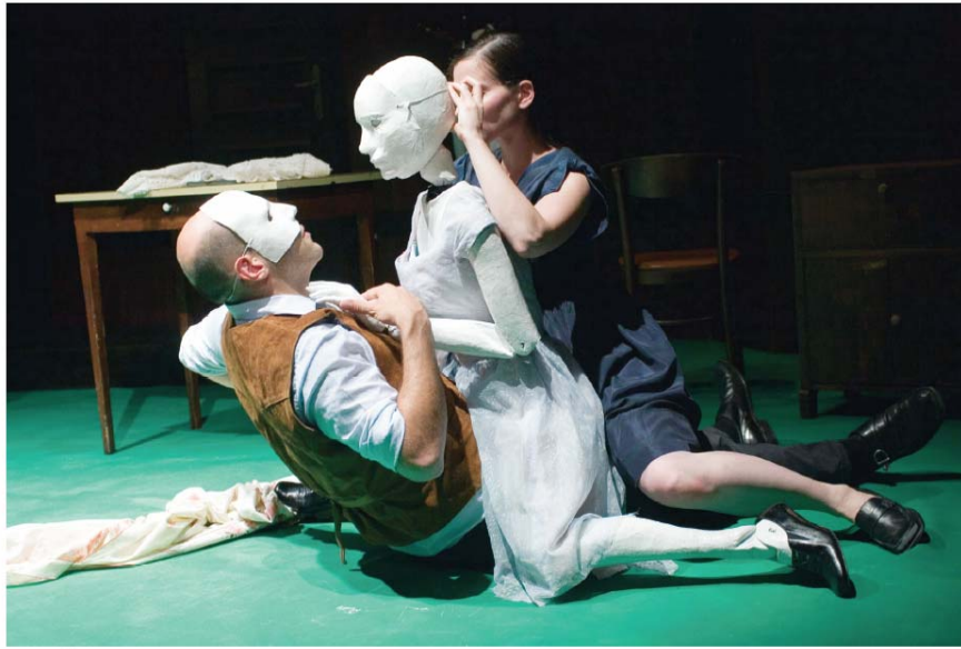
„Üksiku mehe jutustus“.

kus lugu „Alice imedemaal“ on esitatud väga punktiirselt, kuid põhikujundid ja põhilised tegevusliinid on jälgitavad. Lewis Carrolli unenäoloole on leitud vorm, kus tõusevad esile just unenäolisus ja unenäopoeetika. Tagaplaanile on jäetud küll koomika, kuid carrollilik kerge absurd oli täiesti olemas. Lavastus on visuaalsete kujundite, värvi ja valguse mäng valgel linal. Omavahel assotsiatsioone loovatest piltidest tehtud varjuteater on õrn ja ilus.