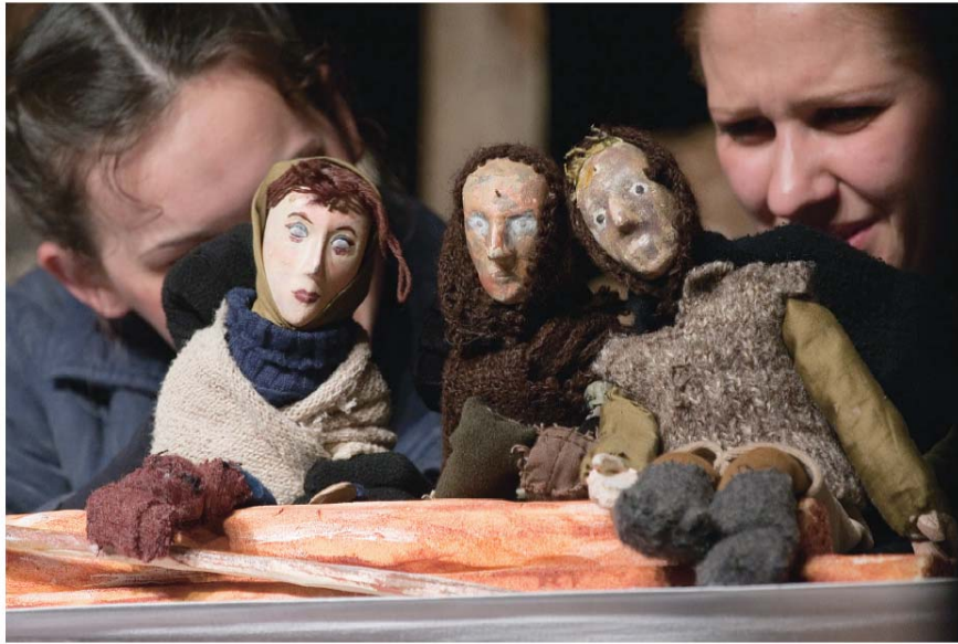
„Laulud okastraataia tagant“.